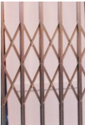
JBT-Standaard / JBT-Standaard-DS